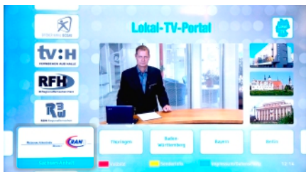
Auswählen des Bundeslandes